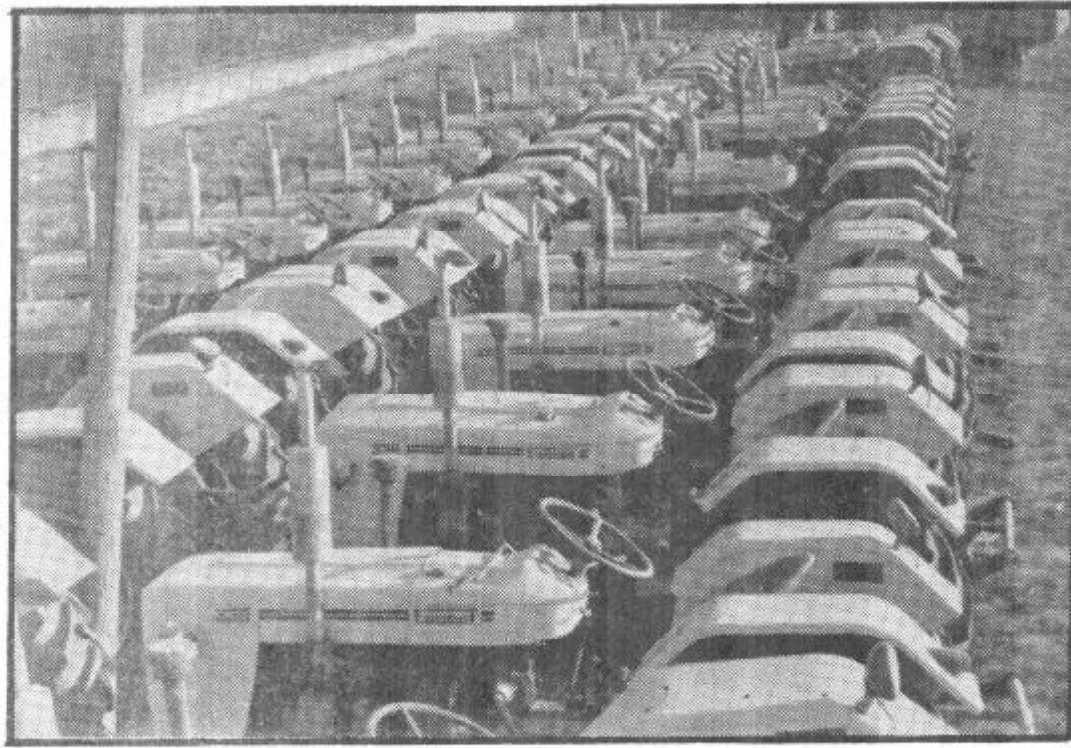
نمایی از هنگر با نسک انکشاف ذرا عتی در کابل که جهت عرضه ما شین ها ولات ذرا عتی به دهقانان آماده میگردد.

دارای فارمهای توت اصلاح شده میباشند. مجهز با پرسونل مسلکی تا سیس گردیده، تا در قسمت طرز بهره برداری پایله مشوره های فنی به پایله وران ارائه نمایند. در صورت تربیه درست کرم پایله یک پیلو و میتواند از یک جعبه تخم پایله ۱۲ گرامه که قیمت آن ۲۵۰ افغانی میباشد، در مدت زمان کمتر از ۳۵ روز مبلغ ۴۵۰۰ الی ۵۰۰۰ افغانی از قیمت محصول غوزه ها بدست آورد. پس میتوان گفت که بنابر اقلیم مساعد، موجودیت درخت توت در نقاط مختلف کشور و بالاخره آرزومندی و توجه ایکه برای انکشاف این صنعت در کشور ما وجود دارد، این امیدواری را پدید می آورد، که در آینده های نزدیک صنعت پایله وری و ابریشم بافی درکشورافزایش و توسعه یابد، و بر حسب پروگرام های سنجنیده شده که در برتو ارزش های مترقی درسامحه انکشاف سکور های تولیدی کشور تطبیق میگردد، این محصول نیز به نحوی که از نظر کیفی مطلوب است، انکشاف یابد.