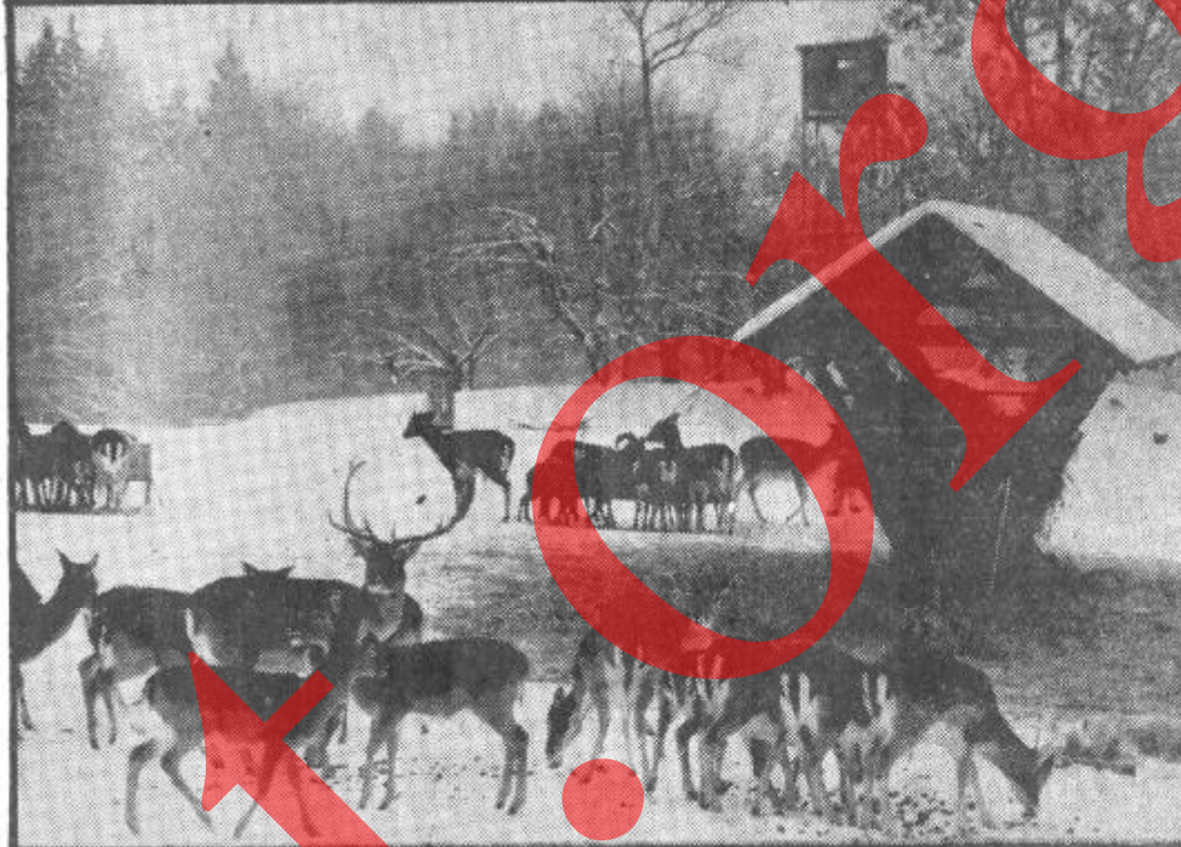
بندگی های حقیقت انقلاب نور

باخود بردارد اینقدر فکس نکرده که اهالی حصه اول خیرخانه کم است؟ در حالیکه به همه معلوم است اهالی حصه اول خیرخانه مینه بعدی زیاد است که پس های موجوده آن به هیچ صورت برای اهالی آن کفایت نمیکند چه خاصا که پس های حصه اول خیرخانه را موظف ساخته اند که اهالی حصه دوم و سوم کارته پروان نتیجه ندادن بالآخره ناچار عرض خویش را با مقامات محترم روزنامه حقیقت انقلاب نور در میان میگفایم. محترما! تخمین یکسال میشود که ریاست محترم ملی پس موتر های لاین حصه دوم کارته پروان از این برده در عرض موتر های حصه اول خیرخانه را از سرگ حصه دوم کارته پروان عبور و مرور داده باین مفرکه که موتر های حصه اول خیرخانه اهالی کارته پروان را