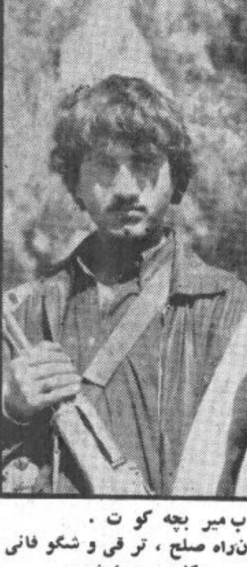
دوتن از مدافعین انقلاب میر بچه کورت - مظفر دو نسل از مبارزان راه صلح، ترقی و شکوفانی میمن دوست داشتنی ما.

به مقصد ارتقای سو به اعضا ت محاروبی قطعات و جزوات های قوای هوا یی و مدافعه هوایی مطابق پلان قبلا طرح شده تطبیقات تکتیکی یکی از جزو تام های قوای راکت دفاع هوا در ساحه ولایت لوگر و سؤ فانه اجرا شد. در این تطبیقات رفیق دگر جنرال عبدالقادر عضو عالی البدل بیروی سیا سی وزیر دفاع ملی جمهوری دموکراتیک افغانستان در حالیکه برید جنرال نظیر- محمد نو ماندان عمر می قوای هوایی و مدافعه هوایی و مدافعه سیاسی قوای هوایی و مدافعه هوایی حاضر بودند اشتراک ورزید. تطبیقات مطابق پلان اجرا و اهداف هوایی با بر تاب راکت ها به صورت صحیح از بین برده شد در ختم تطبیقات رفیق دگر جنرال عبدالقادر وزیر دفاع ملی جمهوری دموکراتیک افغانستان با شا ملیین تطبیقات از نزدیک ملاقات نموده و برای یک تسهیل از اشتراک کنندگان تطبیقات نظر به ابراز لیاقت و جدیت در وظایف شان تحایف توزیع نمود. متعاقبا وزیر دفاع ملی جمهوری دموکراتیک افغانستان با هیات میعیی اش به یکرار رفته از تطبیقات و فایزیکه ترمیم در آن جا دیدن کرد.