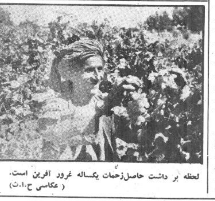
لحظه برداشت حاصل زحمات یکساله غرور آفرین است.

برای تهیه سر بنه و حل مشکل هوپندان از این ناحیه شاروالی کابل طی سال گذشته ۴۰۴۳ نمره زمین را برای مستحقین از طریق کمیسیون های مربوط شاروالی در پنج پروژه شهرتو زیج کرده است. در مورد چگونگی شرایط توزیع زمین باید گفت که در گذشته دستور العملی موجود نبود تا برویت آن استحقاق مراجعین تثبیت میگردد. ولی اینک مسوده دستور العملی ترتیب گردیده که عنقریب مراحل آن طی و به منصفه تطبیق قرار داده خواهد شد که قبلاً در رفع شکایات درخواست دهندگان کمک خواهد نمود. شاروالی کابل بر علاوه در پروژه های خیر خانه مینه