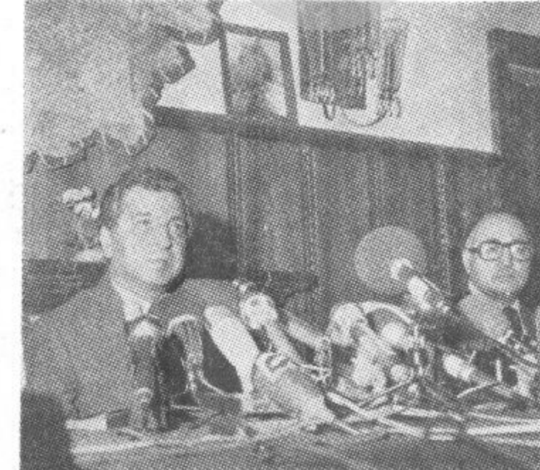
بیرک کارمل منشی عمومی کمیته مرکزی حزب دموکراتیک خلق افغانستان رئیس شورای انقلابی و صدراعظم جمهوری دموکراتیک افغانستان هنگامیکه ژورنالستان داخلی و خارجی را برای مصاحبه مطبوعاتی پذیرفته و به سوالاتشان پاسخ میدهد.

کابل - متن مصاحبه مطبوعاتی، بیرک کارمل، منشی عمومی کمیته مرکزی حزب دموکراتیک خلق افغانستان رئیس شورای انقلابی و صدراعظم با