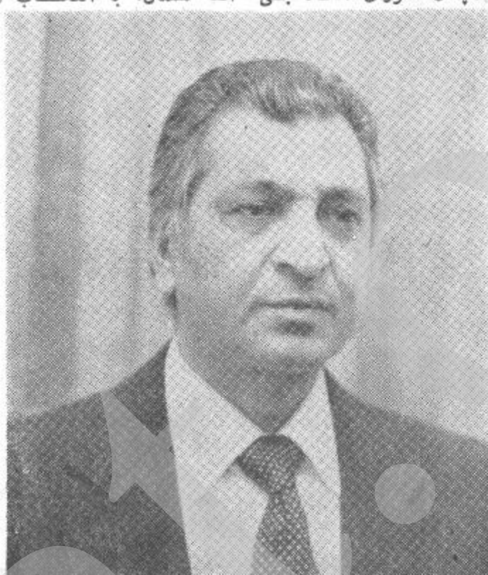
بیرک کارمل منشی عمومی کمیته مرکزی ح. د. خ. افغانستان شورای انقلابی و صدراعظم جمهوری دموکراتیک افغانستان

۳- اسمای اعضای دارالانشاء کمیته مرکزی اعلام گردد. ۴- اسمای اعضای جدید حکومت جمهوری دموکراتیک افغانستان، که از طرف کمیته مرکزی نامزد شده اند پس از تصویب شورای انقلابی جمهوری دموکراتیک افغانستان اعلام گردد. ۵- اسمای اعضای شورای انقلابی جمهوری دموکراتیک افغانستان - نستان اعلام شود. ۶- اسمای اعضای هیات رئیسه شورای انقلابی بار دیگر اعلام گردد. در جلسه پلینوم کمیته مرکزی فیصله بعمل آمد که مطابق به اصول و موازین اساسنامه و بر حسب شرایطی که در شرایط لازم، کمیته مرکزی، دفتر سیاسی کمیته مرکزی و دارالانشاء کمیته مرکزی حزب دموکراتیک