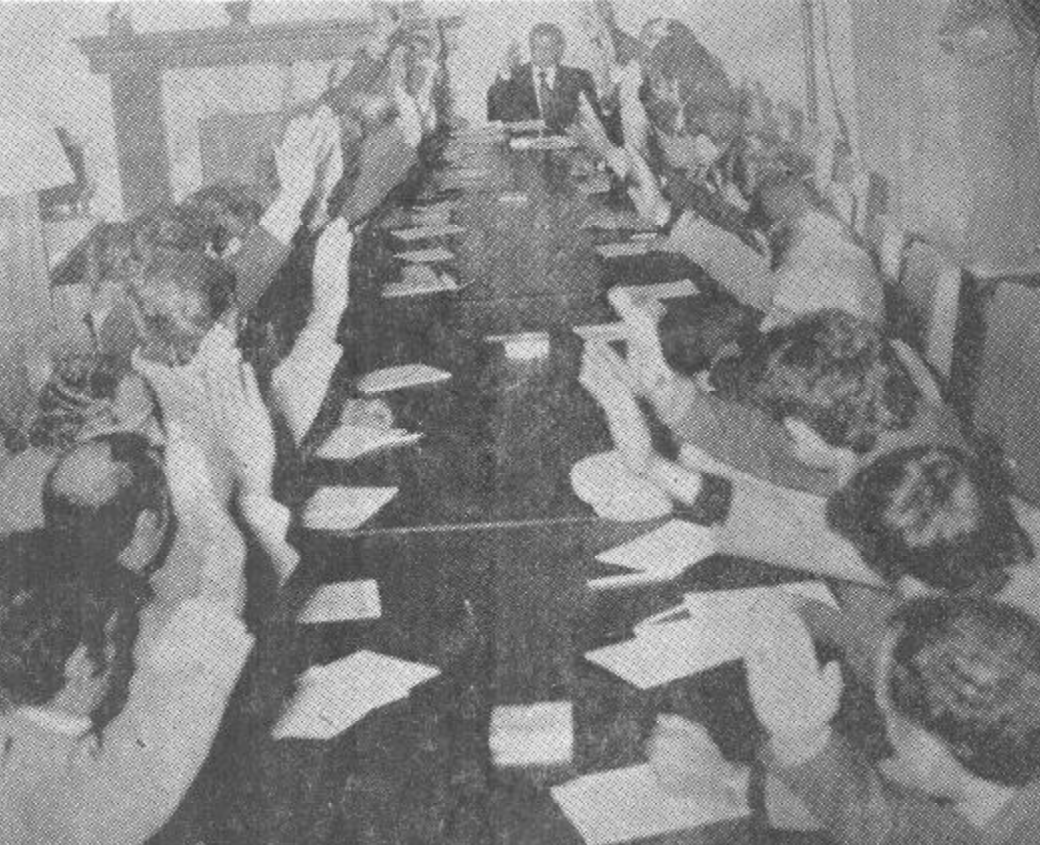
نمای از جلسه شوروی انقلابی - ح. د. خ. ا. که در عمارت چهلستون دایر گردیده بود.