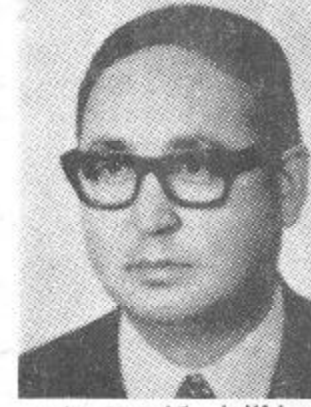
سلطانعلی کشتمند عضو پوروی سیاسی کمیته مرکزی ح. د. خ. ا. معاون صدراعظم و وزیر پلان