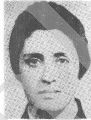
دوکتور اناهیتا راتب زاد عضو پوروی سیاسی کمیته مرکزی ح. د. خ. ا. و وزیر تعلیم و تربیه