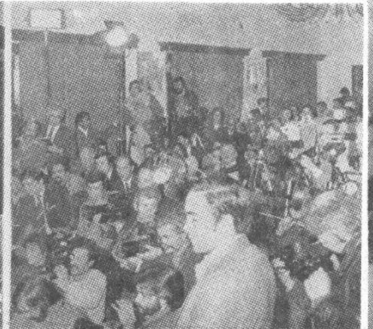
نمای از جلسه شوروی انقلابی - ح. د. خ. ا. که در عمارت چهلستون دایر گردیده بود.