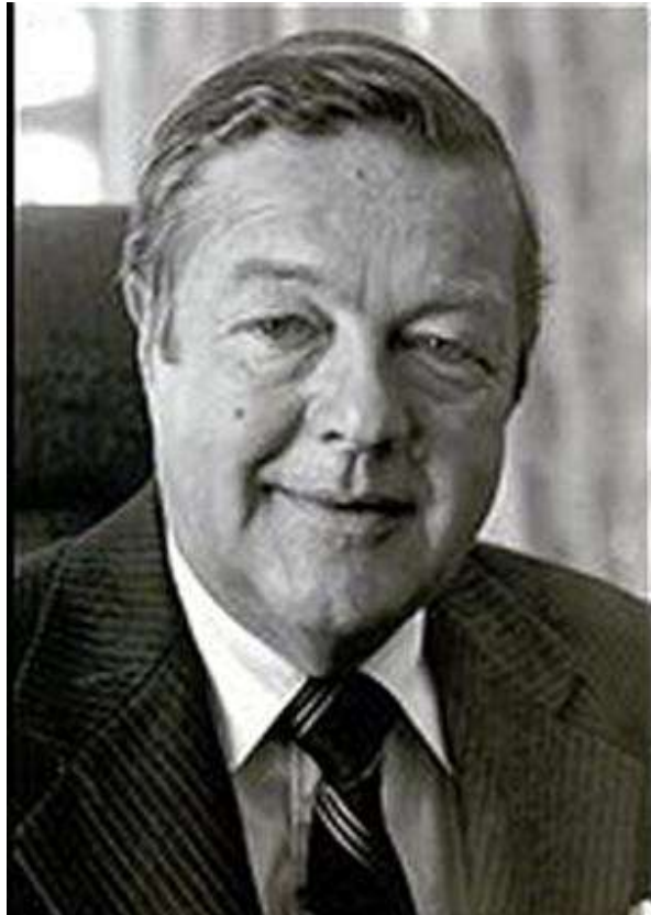
آرچر بلود، آخرین دیپلمات آمریکایی که با امین دیدار کرد