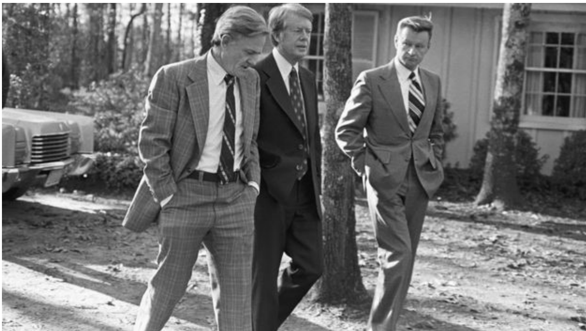
برژینسکی (راست) مشاور امنیت ملی جیمی کارتر (وسط)، رئیس جمهور آمریکا در زمان تهاجم شوروی به افغانستان بود

اشغال افغانستان نمونه‌ای است که دو ابرقدرت شوروی و آمریکا در اوج جنگ سرد، ترس از نیت و فعالیت‌های پنهانی همدیگر را جایگزین تحلیل واقعی از رفتارهای همدیگر کردند و واکنش نشان دادند.