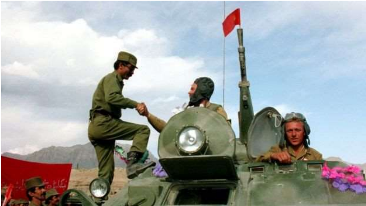
سربازان روس در افغانستان

در این طرح که مورد تصویب بیروی سیاسی قرار گرفت آمده: "تصویب، ارزیابی و تمهیداتی که توسط آندروپوف، استینوف و گرومیکو در نظر گرفته شده و اعطای صلاحیت به آنها برای اجراءات" و در بند دوم ارایه گزارش اجراءات به بیروی سیاسی توسط این سه نفر آمده است.