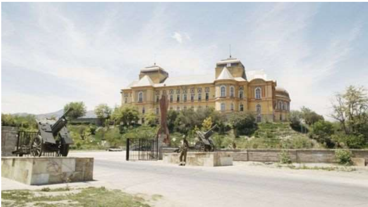
قصر دارالامان در کابل زمانی مرکز فرماندهی نیروهای شوروی در افغانستان محسوب می‌شد

ترنر از احتمال تغییر امین نیز صحبت می‌کند.