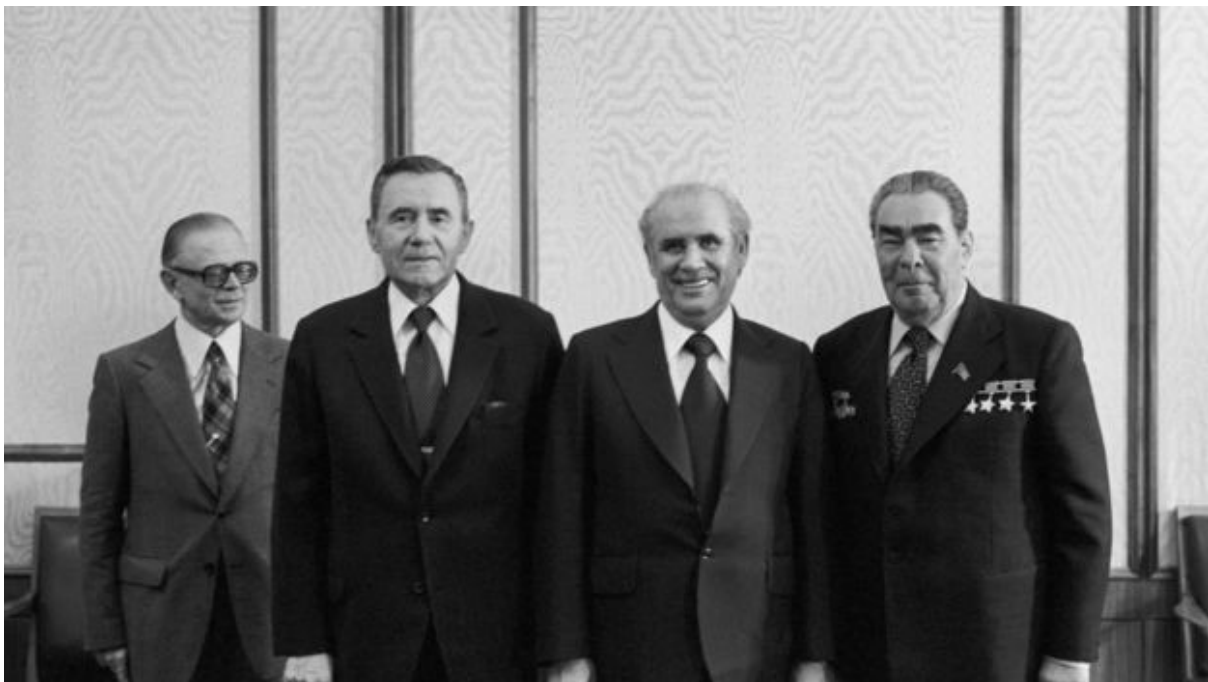
نور محمد ترهکی (نفر وسط) یک هفته پیش از کشته شدنش با لئونید برژنف (راست)، رهبر شوروی و آندره گرومیکو (چپ) وزیر خارجه شوروی در مسکو دیدار کرده بود

اسناد بیروی سیاسی شوروی نشان می‌دهد که در ماه اکتبر یک تغییر ناگهانی در رویکرد رهبری شوروی نسبت به افغانستان رخ داد. دو حادثه در ماه اکتبر زنگ خطر را برای مسکو به صدا درآورد؛ کشته شدن ترهکی و دیدار حفیظ الله امین با آرچر بلود، دیپلمات آمریکایی در کابل در ۲۷ اکتبر.